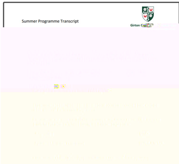
图：剑 大 学 书 与 单 图